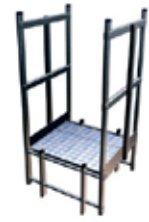
Palier de passage d'acrotère + redescente sans portillon