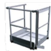
Palier de sortie latérale avec portillon