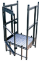
Palier de passage d'acrotère + redescente avec portillon