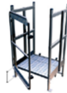
Palier de passage d'acrotère + pieds réglables avec portillon