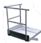
Palier de sortie latérale sans portillon