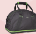
SACS DE TRANSPORT