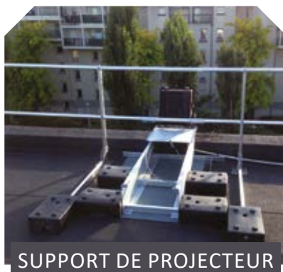
SUPPORT DE PROJECTEUR