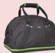
SACS DE TRANSPORT