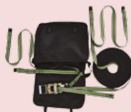
LIGNE DE VIE PROVISOIRE & ACCESSOIRES