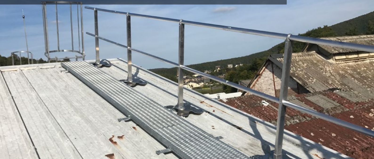
PLANCHE DE CIRCULATION